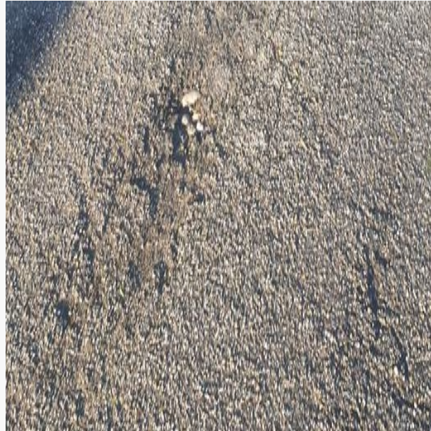
SLAGHULLER, REVNER OG UDTØRRET BITUMEN