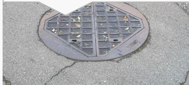
REGN- OG SPILDEVANDSBRØNDE

Ejes og drives af forsyningselskabet. Udgifter til udskiftning eller omsætning afholdes af forsyningselskabet