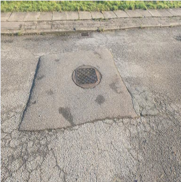
KRAKELERINGER, LUNKE, ØDELAGT BETONKANTSTEN